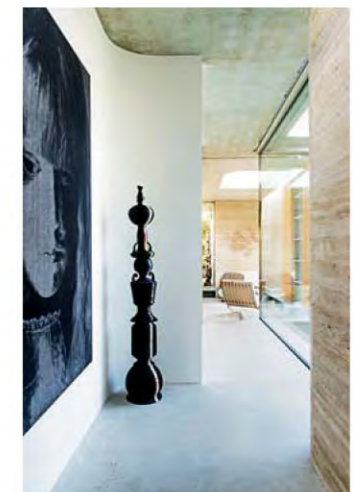
En haut et ci-dessus : Grâce à des meubles et à des éclairages soigneusement choisis – des éléments plutôt classiques cohabitant avec d'autres plus contemporains –, les propriétaires mettent en valeur leur collection de sculptures, de photographies et de peintures qui rassemble des artistes tels que Tiong Ang, Neil Clements, Navid Nuur ou Moyna Flannigan.

« Ce projet allie technique et atmosphère », déclare Stefan De Bever qui souhaitait créer un pavillon dépourvu de structures visibles. Les panneaux vitrés de la façade sont directement reliés à la pierre par l'intermédiaire de cadres en acier intégrés au plafond et au sol en béton. Le pavillon offre 77 m 2 supplémentaires de surface habitable : d'un côté, le salon en contrebas et, de l'autre, la chambre du fils avec salle de bains attenante. Entre ces deux volumes, face au jardin, le cabinet De Bever Architecten a intégré une piscine sophistiquée bien que de dimensions modestes. Elle ne mesure que 4,60 x 3,40 m, mais un dispositif de contre-courant permet d'y trouver son plaisir en termes d'efforts. Le mur séparant la piscine de la salle de bains est revêtu de calcaire coquillier, une roche naturelle qui, de par ses coloris et sa texture poreuse, ressemble au travertin. La salle de bains, tapissée de mosaïque de verre au