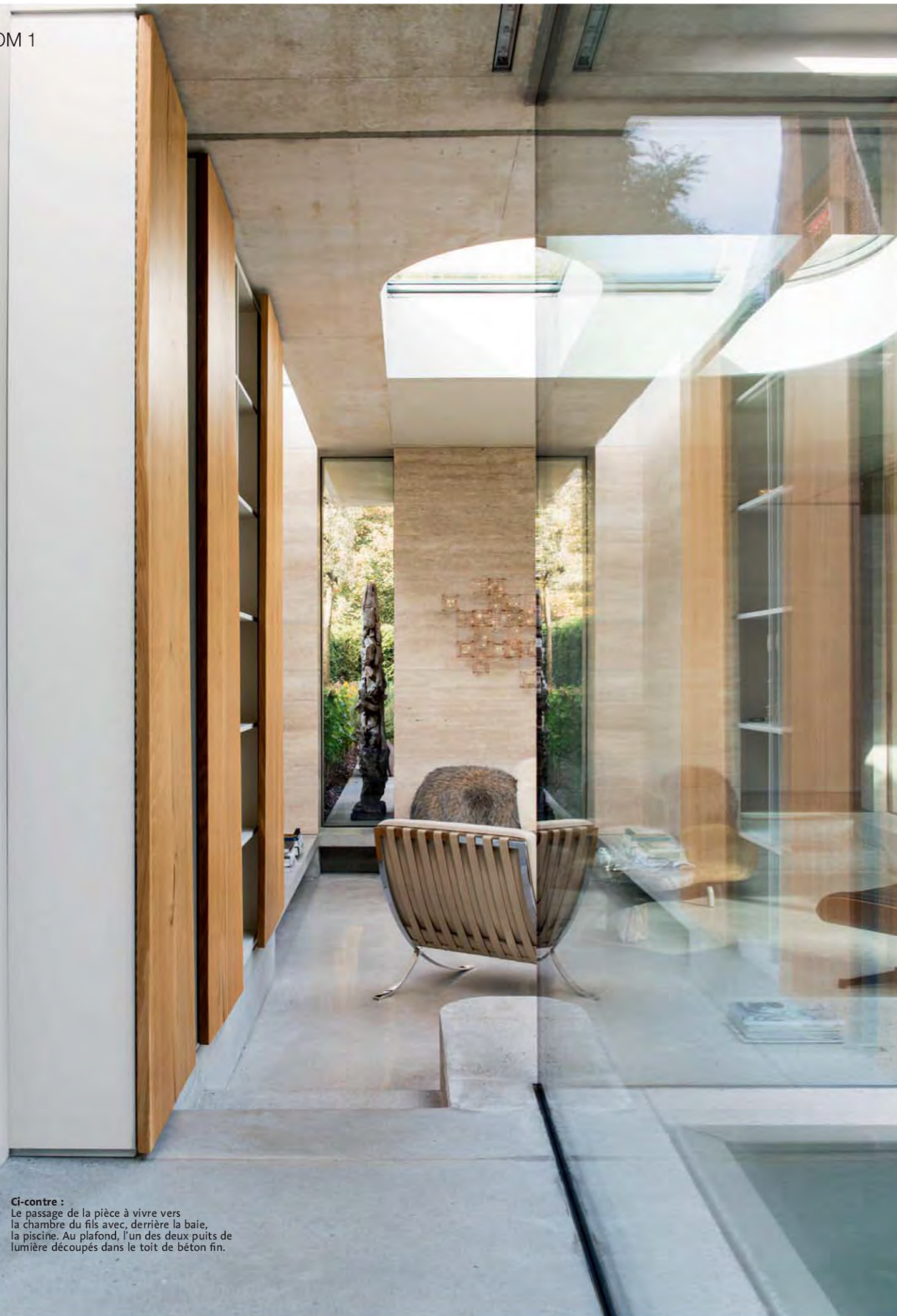
Ci-contre : Le passage de la pièce à vivre vers la chambre du fils avec, derrière la baie, la piscine. Au plafond, l'un des deux puits de lumière découpés dans le toit de béton fin.